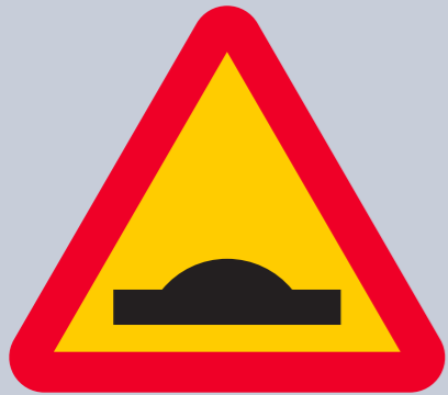
A9. Varning för farthinder