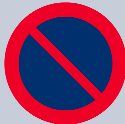
C35. Förbud mot att parkera fordon