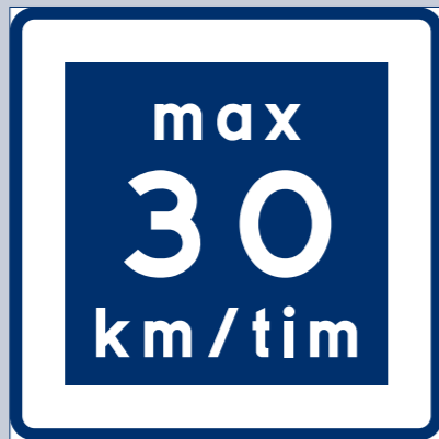
E11. Rekommenderad lägre hastighet